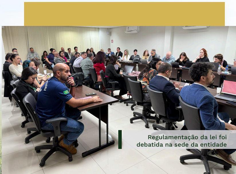
Regulamentação da lei foi debatida na sede da entidade

A Lei dos Bioinsumos foi sancionada no final de 2024 e no ano de 2025 o MAPA criou um Grupo Técnico através da Portaria SDA/MAPA 1270 de 2025. Porém, em janeiro de 2025 a Aprosoja Brasil iniciou a discussão dos pontos que deveriam ser regulamentados. Para isso, criou um GT de entidades do setor, este de caráter privado, com 21 entidades de produtores, pesquisa e indústria.